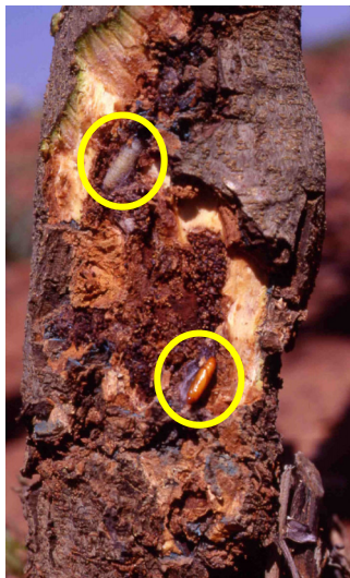
Foto 5: Larva y crisálida de Euzophera bajo la corteza del olivo (M. Rodríguez)

El adulto es una mariposa de 2-2,5 cm de envergadura alar de color marrón grisáceo, con dos bandas transversales más claras, cuya puesta se realiza en las bifurcaciones de las ramas principales, grietas, rugosidades, heridas, nódulos de tuberculosis, etc. La larva es blanquecina con matices amarillentos o verdosos que llega a alcanzar los 2,5 cm y excava galerías entre la corteza y la madera.