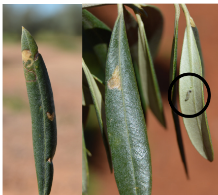
Foto 1: Galerías en hoja y larva de prays. Generación filófaga.

los adultos realizan la puesta en el fruto recién cuajado, al nacer las larvas penetran en el fruto por la inserción del pedúnculo lo que puede producir la primera caída de frutos por prays (caída de San Juan).