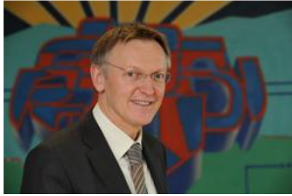
Janez Potocnik (Comisario de Medio Ambiente): Agenda