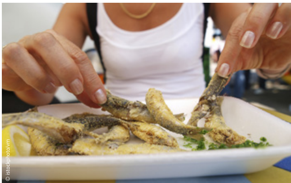
La demanda de pescado va en aumento.

Aun así, continúan existiendo deficiencias en la gobernanza por lo que respecta a la gestión sostenible de los océanos. La UE ya desempeña un papel importante en la mayoría de los foros marítimos internacionales. La Comisión Europea dispone ahora de un claro mandato para participar en la configuración de la gobernanza internacional de los océanos en las Naciones Unidas, en otros foros multilaterales y, bilateralmente, con socios clave a nivel mundial, con el objetivo de adoptar un marco mejorado, más sostenible y con mejores garantías de aplicación. De aquí saldrá, entre otras cosas, la publicación de una Comunicación de la Comisión sobre la gobernanza de los océanos y la economía azul. Esta iniciativa reforzará la lucha de la UE contra la pesca ilegal y la contaminación marina, así como potenciará la labor de los organismos regionales de pesca, colmará los vacíos legales, aumentará la eficacia de la cooperación, mejorará el cumplimiento de las normas y estimulará la inversión en investigación y conocimiento de los océanos.