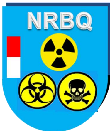
Distintivo de Especialista en N.R.B.Q

Distintivo sobre fondo rojo. Iniciales PA en color plata. Libro abierto bajo lupa, con fábrica al fondo. Franja lateral en colores rojo y blanco en el lateral izquierdo.