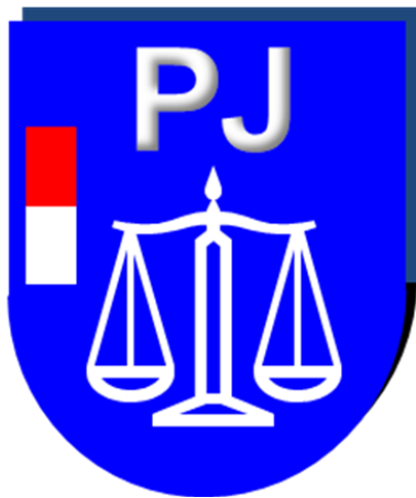
Distintivo de Especialista en Policía Judicial

Las distinciones de especialista tendrán unas dimensiones de 3 cm de altura por 2,5 cm de anchura, con el siguiente formato: