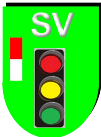
Distintivo de Especialista en Seguridad Vial

Distintivo sobre fondo azul cobalto. Iniciales PJ en color plata en su parte superior. Balanza de justicia en color blanco. Franja en colores rojo y blanco en el lateral izquierdo.