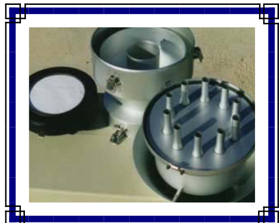
Cabezal PM10 desmontado sobre un equipo CAV

Se utiliza como referencia documental, en el establecimiento de los principios técnicos que rigen el presente ejercicio de intercomparación, la norma UNE-EN 12341:1999, así como la guía de la Comisión Europea sobre medidas de PM10 e intercomparación con el método de referencia.