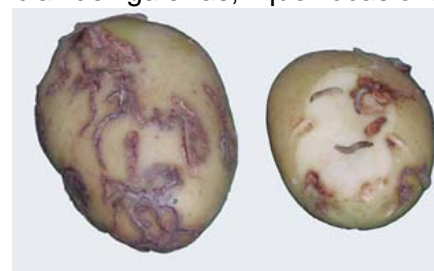
Galerías superficiales en tubérculo de patata producidas por T. solanivora .