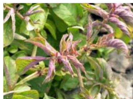
Plantas de patata afectadas por CalSol. Brotes con coloraciones púrpuras y ahuecamiento de hojas. (USDA-ARS). Plan Nacional de Contingencia 2017 MAPAMA