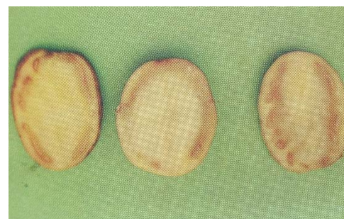
Podredumbre parda ( Ralstonia solanacearum ) (Ministerio de Agricultura Pesca y Alimentación-año 1995)

Si la infección está muy desarrollada, al presionar aparecen exudados, gotitas pastosas blanquecinas de mucus bacteriano en el anillo vascular.