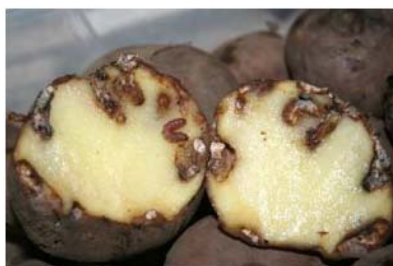
Tubérculo dañado por T.solanivora saliendo del

Cuando las larvas emergen, penetran en el tubérculo para alimentarse provocando la presencia de galerías, que ocasionan importantes daños en el cultivo y en el almacén.