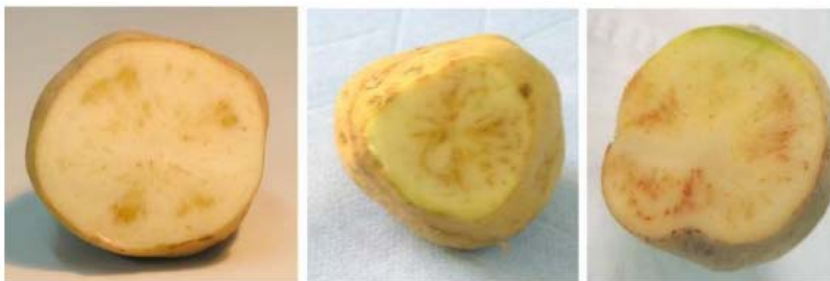
Síntomas de CaLsol en tubérculos analizados. (IVIA) Plan Nacional de Contingencia 2017 MAPAMA

En España, los vectores identificados como transmisores de la bacteria son distintas especies de psílidos.