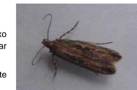
Adulto de T. solanivora .

Se trata de una enfermedad regulada no cuarentenaria que produce síntomas como enrollamiento de las hojas hacia el haz, coloración amarilla del follaje, entrenudos cortos, coloración púrpura del tejido joven, producción de tubérculos aéreos, reducción del tamaño del tubérculo y decoloración del mismo.